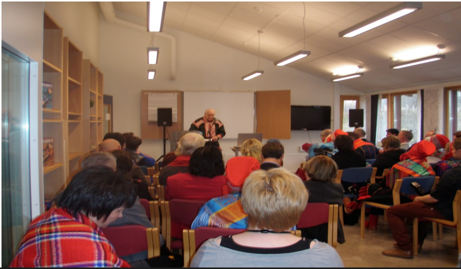
Sámi lohanguovddáža rahpamis 2010s.