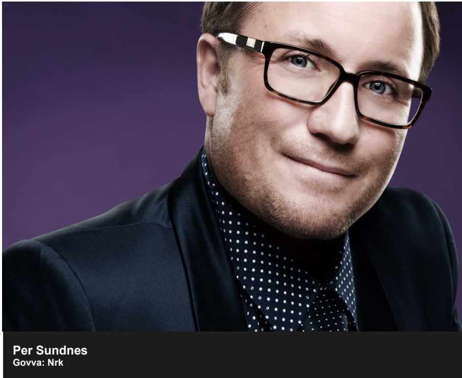
Per Sundnes Govva: Nrk